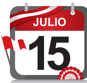
Gratificación por FIESTAS PATRIAS