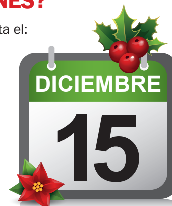
Gratificación por NAVIDAD

No se puede pactar el pago de las gratificaciones en fecha distinta a la señalada por ley.